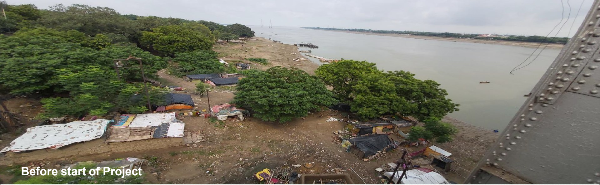
Before start of Project