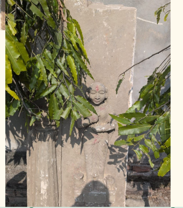
पुनर्स्थापना हेतु संस्कृति विभाग में संरक्षित