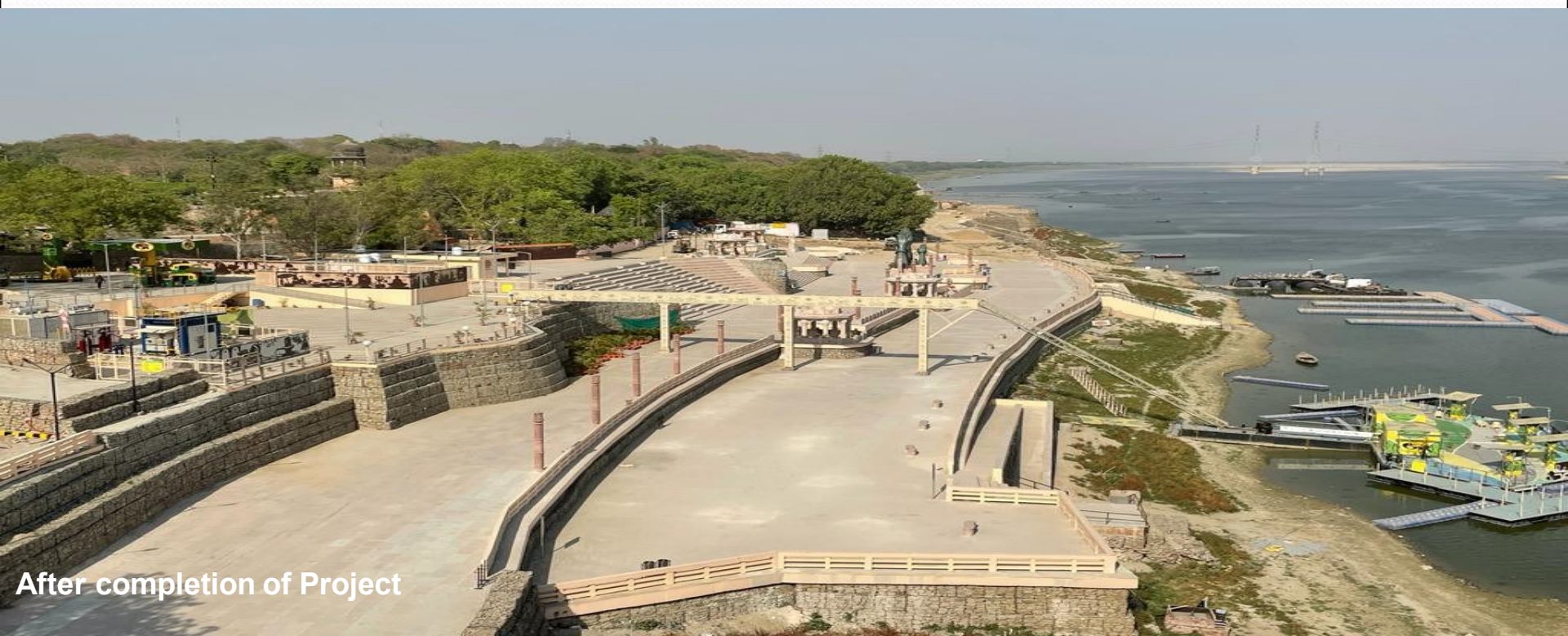
After completion of Project