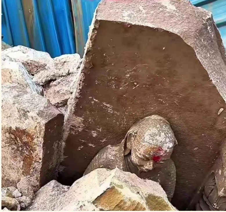
पुनर्स्थापना से पूर्व