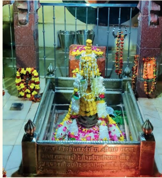
मसान नाथ मंदिर